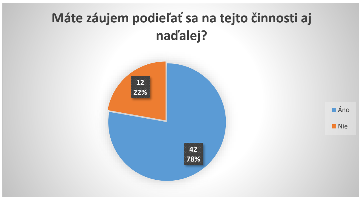
Graf 2: Záujem o činnosť

12 respondentov sa vyjadrilo, že už viac nemajú záujem podieľať sa na činnosti spojenej s periodickým hodnotením ŠP a OHIK na UCM, zatiaľ čo 42 respondentov uviedlo, že naďalej tento záujem majú.